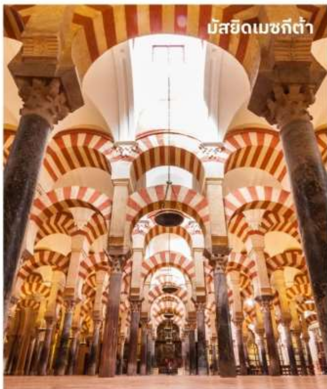
มัสยิดเมซquita

บริการอาหารเช้า ณ ห้องอาหารของโรงแรม หลังจากนั้นนำท่าน เข้าชมมัสยิดเมซquita ที่มีขนาดใหญ่โตและออกแบบอย่างวิจิตรด้วยการใช้เสาหินจำนวนมากถึง 850 ต้น ต่อยอดเสาด้วยโครงสร้างคานโค้งแบบศิลปะโรมัน ผสมกับลวดลายแบบมัวร์ช ประดับด้วยเครื่องกระเบื้องเคลือบ อิฐ และหินฉลุลาย กว้างทั้งอาคาร ด้านในสุดของมัสยิดจะสร้างมีหรับ อันเป็นเครื่องหมายแสดงทิศทางของเมืองเมกกะ ต่อมาเมื่อชาวคริสต์เข้ามายึดครองเมืองคอร์โดบา จึงได้มีการสร้างโบสถ์ขึ้นบริเวณกึ่งกลางของมัสยิด และสร้างหอระฆังสูง 93 เมตร ขึ้นในบริเวณสวนส้มและลานน้ำพุ