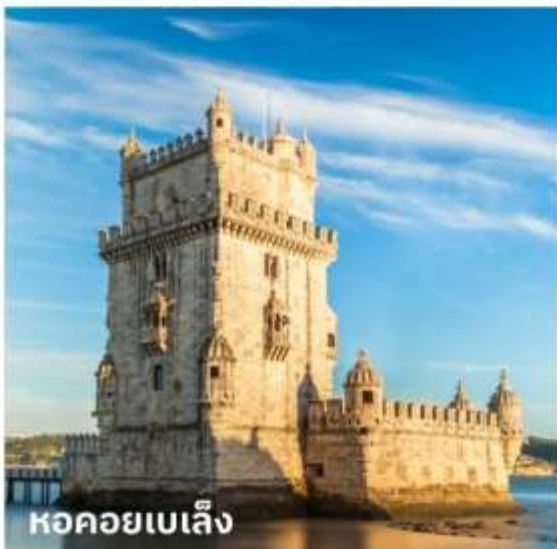
หอคอยเบเล็ง