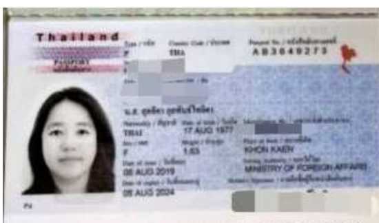
ตัวอย่าง หน้าพาส ยื่น VISA EGYPT