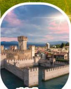
ซีร์มิโอเน