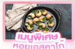
เมนูพิเศษ หอยออสตาโก้

เยอรมัน เนเธอร์แลนด์ เบลเยียม ฝรั่งเศส Keukenhof