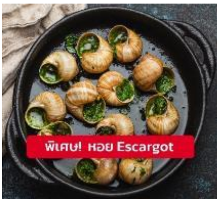
พิเศษ! หอย Escargot

เย็น 🎯 รับประทานอาหารเย็น (มื้อที่12) เมนูพิเศษ!! หอยเอสคาโก้ (Escargot)