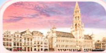
บรัสเซลส์