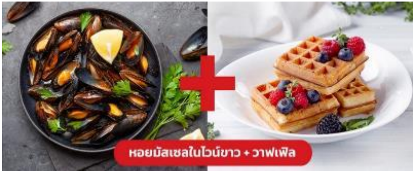
หอยมัสเซลไวน์ขาว + วาฟเฟิล

เย็น 🍷 รับประทานอาหารเย็น (มือที่10) เมนูพิเศษ!! หอยมัสเซล + วาฟเฟิล (Mussel in White wine + Waffle)