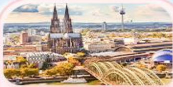
มหาวิหารโคโลญ