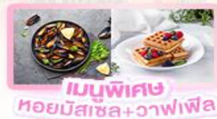
เมนูพิเศษ หอยมัสเซล+วาฟเฟิล