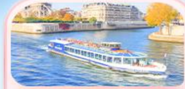
คลองเรือแม่น้ำแซน