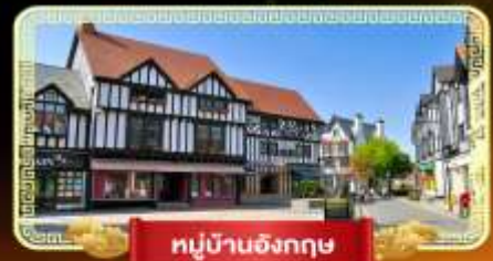
หมู่บ้านอังกฤษ