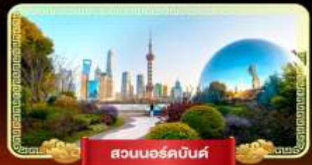
สวนนอร์คบันด์