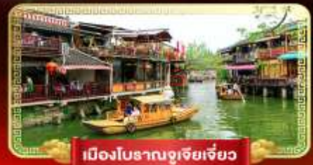
เมืองโบราณซูเจียเจี้ยว

เที่ยวสวนสนุกในฝัน "ดิสนีย์แลนด์" ล่องเรือชมเมืองโบราณซูเจียเจี้ยว