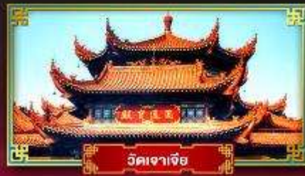
วัดเจาเจีย