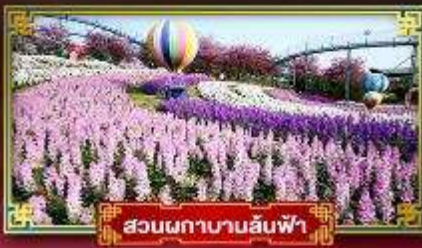
สวนดอกบานล้นฟ้า