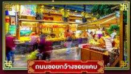
ถนนชอยกวางชอยแคบ