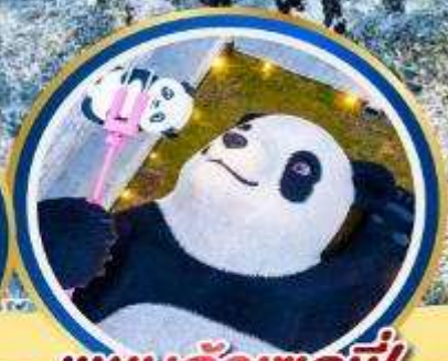
แพนต้าเซลฟี