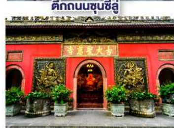
วัดต้าฉีอ้อ