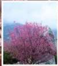
ชมดอกท้อภูเขาไถ่ซาบ