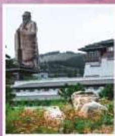
รูปปั้นงจื้อ ที่ใหญ่ที่สุดในโลก