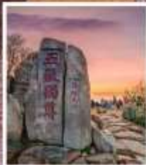
หินแกะสลักในสมัย ราชวงศ์ถัง