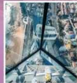
QINGDAO HAITIAN CENTER