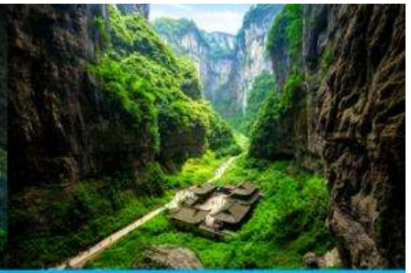
สะพานธรรมชาติสามแห่ง