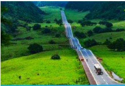
อุทยานเขานางฟ้า