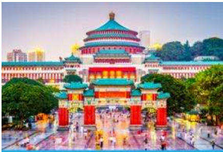
ศาลาประชาชน