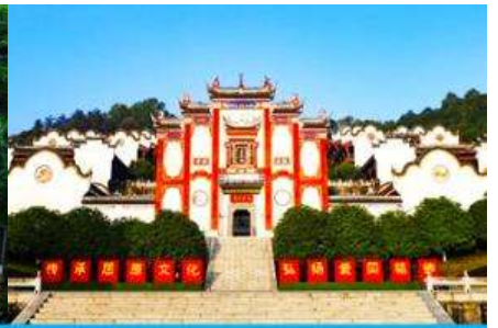
บ้านเกิดกวี ขวี่หยวน

วันที่สอง ล่องเรือแม่น้ำแยงซีเกียง-เขื่อนลิฟท์น้ำ-สวนถ้ำสามสหาย-บ้านเกิดกวี ขวี่หยวน-เมืองเทพริดา