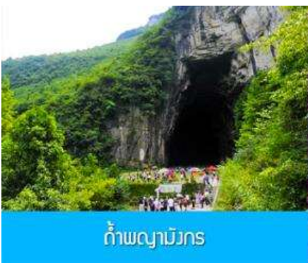
ถ้ำพญามังกร

พักที่ VIENNA HOTEL โรงแรมระดับ 4 ดาวหรือเทียบเท่าในเมืองเอินชือ