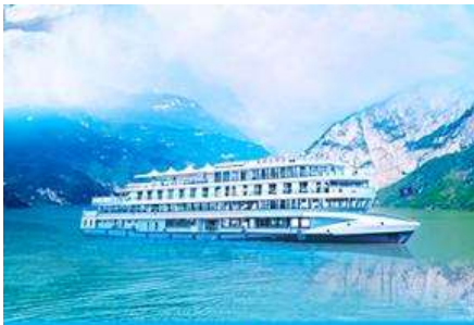
ล่องเรือชมเขื่อนสามผา