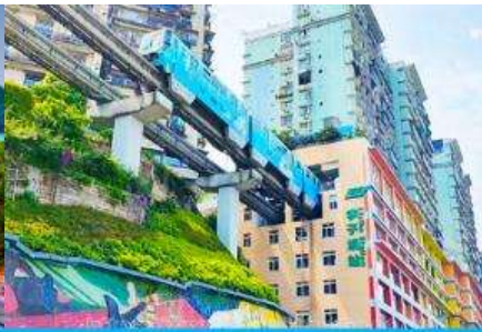
รถไฟวิงกะตุ๊ก