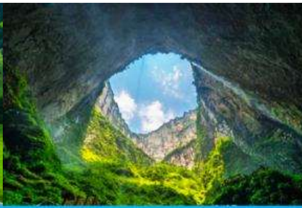
อุทยานหลุมฟ้า