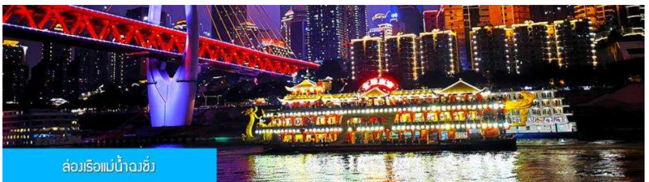
ล่องเรือแม่น้ำฉงชิ่ง