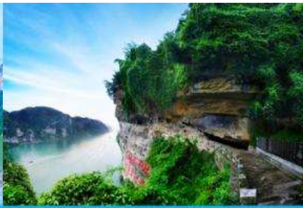
สวนถ้ำสามสหาย