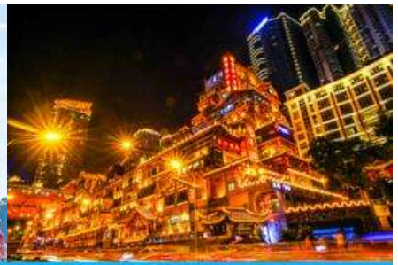
ย่านหงหยาดัง