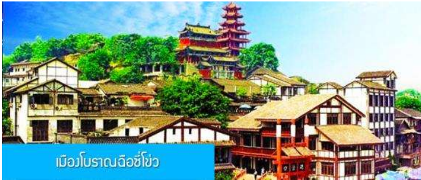
เมืองโบราณฉือชิว