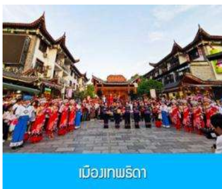
เมืองเทพริดา