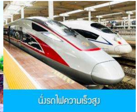
รถไฟความเร็วสูง