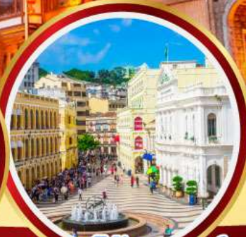
เซนาโดสแควร์