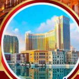
เดอะเวเนเชียน