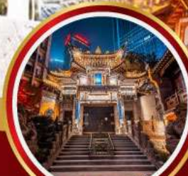
วัดหลัวอัน