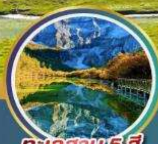
ทะเลสาบ 5 สี