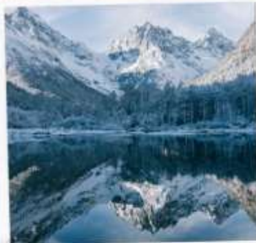
อุทยานปีเพิงโกว