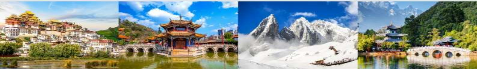
วัดลามะชงจันหลิน