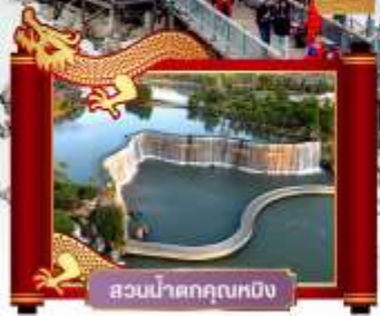
สวนน้ำตกคุนหมิง

พิเศษ! โชว์จางอวี้โกเปว "ความประทับใจลี่เจียง"