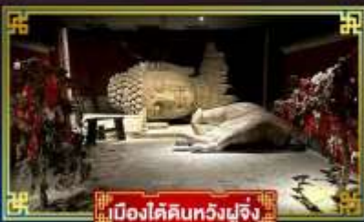
เมืองใต้ดินหวงฝูจิ่ง

“กำแพงหิมะ”...สิ่งมหัศจรรย์ของโลก พระราชวังต้องห้าม อดีตพระราชวังหลวงสุดยิ่งใหญ่