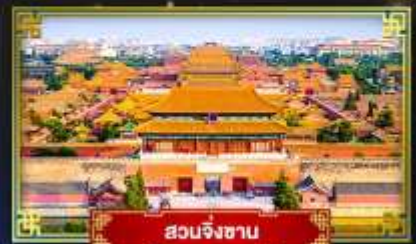
สวนจิงซาน