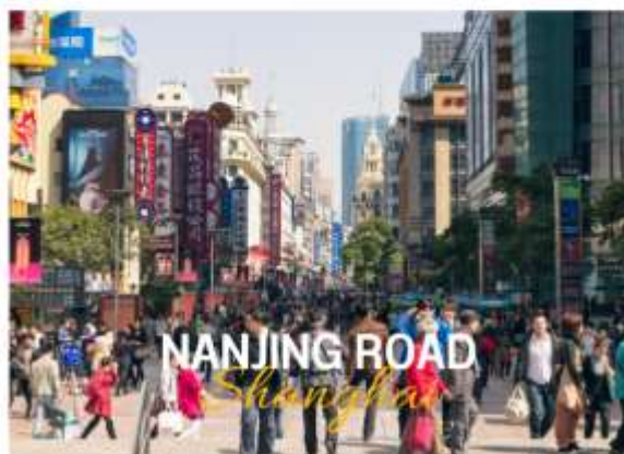
NANJING ROAD Shanghai

ถนนหนานจิง หรือที่รู้จักกันอีกชื่อว่า นานกิง ย่านช้อปปิ้งที่เก่าแก่และมีชื่อเสียงที่สุดในเซี่ยงไฮ้เลยในตอนเย็นจะเป็นช่วงที่ร้านค้าและบาร์ต่างๆกำลังคึกคักมีนักดนตรีริมถนนเต็มไปด้วยแสงสีเสียงเหมาะกับการเดินเล่นหรือนั่งรถรางชมบรรยากาศรอบๆฝั่งตะวันตกจะมีห้างสรรพสินค้าใหญ่ๆสลับกับร้านแบบจีนดั้งเดิมอยู่ตลอดสองข้างทาง