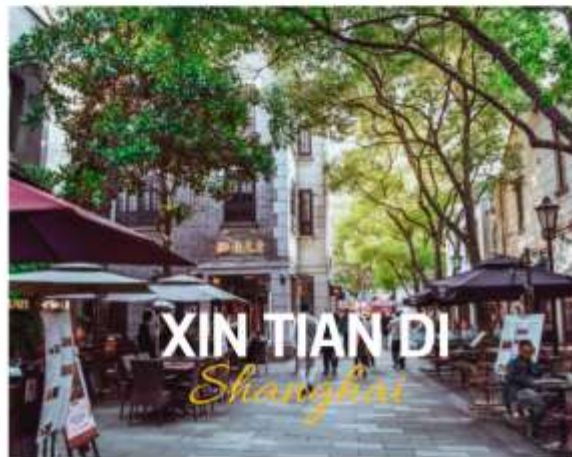
XIN TIAN DI Shanghai

ย่านใหม่ใจกลางเมืองเซี่ยงไฮ้ อีก 1 ย่านช้อปปิ้งและร้านอาหาร ร้านอาหาร ที่มีเอกลักษณ์ จากสถาปัตยกรรมที่ใช้อิฐบล็อกแบบสถาปัตยกรรมซีกเขมิน ซึ่งเป็นการผสมผสานกันระหว่างสถาปัตยกรรมจีนกับตะวันตกเข้าด้วยกัน ท่านจะพบกับทางเดินหิน กำแพงหิน ประติมากรรม ที่มีเอกลักษณ์ โดย 2 ทางของถนนมีต้นเมเปิ้ลตลอดทาง ยิ่งทำให้ย่านนี้มีเสน่ห์เพิ่มเป็นเท่าตัว