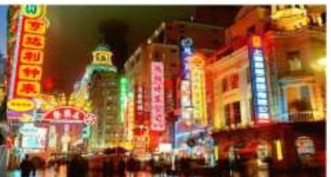
ถนนนานกิง

*ทางบริษัทฯ ขอสงวนสิทธิ์ในการสลับโปรแกรมทัวร์ตามความเหมาะสมขึ้นอยู่กับสถานการณ์หน้างาน โดยคำนึงถึงผลประโยชน์ของลูกค้าเป็นสำคัญ