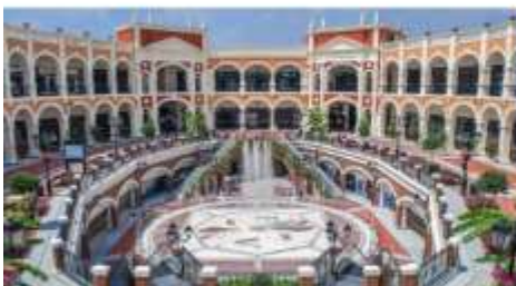
Florentia Village Outlet