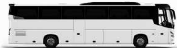
ตัวอย่างรถทัวร์ 1 คัน

ค่าที่พักตามที่ระบุในรายการหรือเทียบเท่าระดับเดียวกัน (ห้องพักละ 2 ท่าน) หากประเภทห้องพักท่านริเวรสนาเดิม อาทิ เช่น ริเวรสห้องพักเป็น TWIN BED หรือ DOUBLE BED ทางบริษัทขอสงวนสิทธิ์ในการปรับประเภทห้องพัก เป็นตามที่โรงแรมมีอยู่ โดยไม่ต้องแจ้งให้ทราบล่วงหน้า