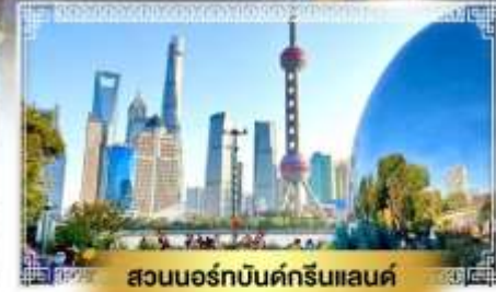
สวนนอร์คัมดังก์รินแลนด์