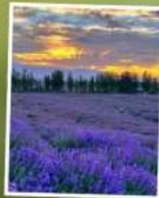
ทุ่งดอกลาเวนเดอร์