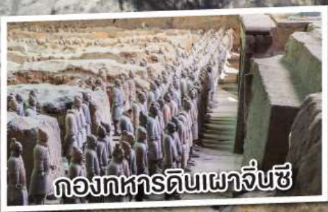
กองทหารดินเผาจีนซี