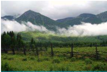
อุทยานคาบาสือ