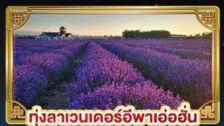
ทุ่งลาเวนเดอร์อิฟาอ้อฮิ้น