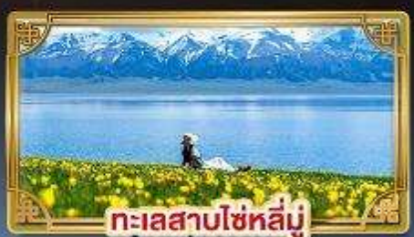
ทะเลสาบไซไห่หลี่มู่