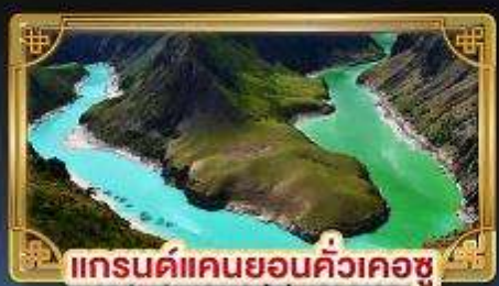
แกรนด์แคนยอนคิ้วเคอซู