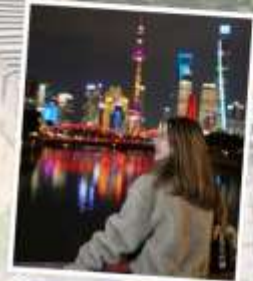
เซี่ยงไฮ้ คลาสสิก ไนท์