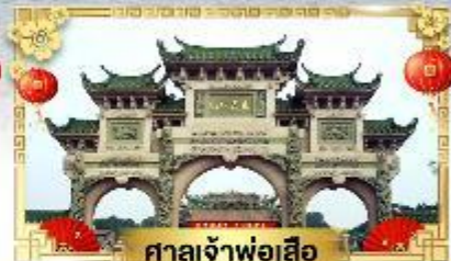
ศาลเจ้าพ่อเสือ