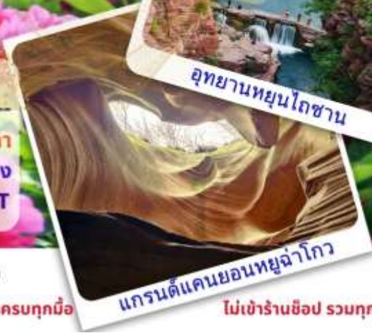
แกรนด์แคนยอนหยูฉ่าโกว