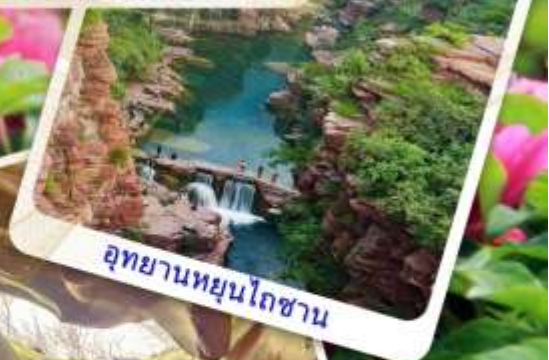
อุทยานหยุนโกซาน