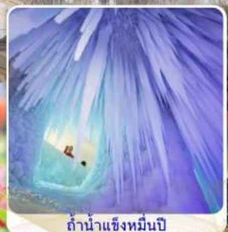
ถ้ำน้ำแข็งหมื่นปี