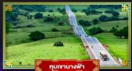
หุบเขานางฟ้า