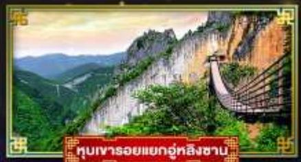
หุบเขารอยแยกอู่หลิงซาบ