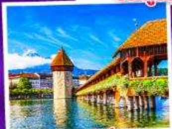
ลูซิเิร์น