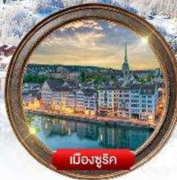
เมืองซูริก