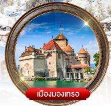
เมืองมงเทรอ