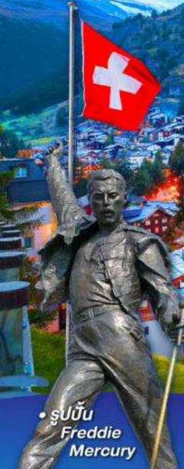
• รูปปั้น Freddie Mercury

พีชิต 5 เวกริก, เวกฮาร์ดเคอ์คุม, เวกจุงเฟรรา เวกลาเซียร์ 3000 และ เวกกรอนเนือร์แกรต