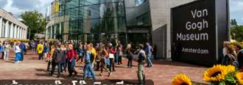
เข้าชมแวนโก๊ะมิวเซียม