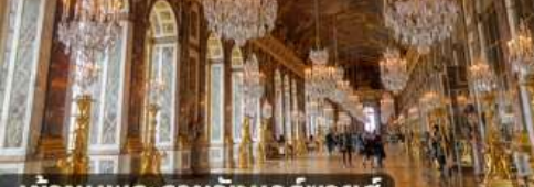
เข้าชมพระราชวังแวร์ซายส์