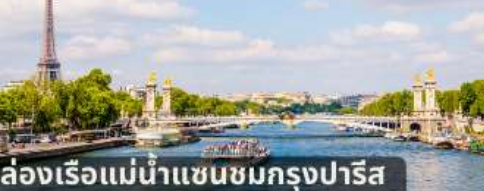
ล่องเรือแม่น้ำแซนชมกรุงปารีส