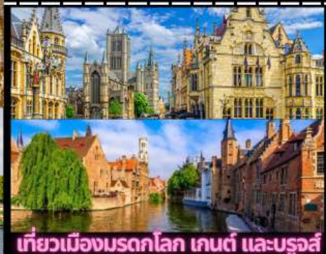
เที่ยวเมืองมรดกโลก เกนต์ และบรูจส์