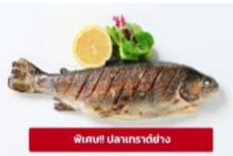
พิเศษ! ปลาเทราต์ย่าง

นำท่านเดินทางสู่ เมืองลินซ์ (Linz) (ระยะทาง 125 กม./ 2 ชม.) เป็นเมืองที่มีการผลิตเหล็ก เครื่องจักร อุปกรณ์ไฟฟ้า อดีตเป็นศูนย์กลางการค้าที่สำคัญ ให้ท่านถ่ายรูปบริเวณด้านนอก พิพิธภัณฑ์แห่งโลกอนาคต (Ars Electronica Center) ตั้งอยู่ริมแม่น้ำดานูบ เป็นที่จัดแสดงวิทยาการต่างๆ ที่ส่งผลต่อมวล มนุษย์ปัจจุบัน ไม่ว่าจะเป็นอวกาศ หุ่นยนต์และเอไอ ยารักษาโรค เป็นต้น