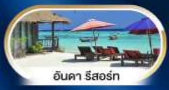
อินคา รีสอร์ท

บินตรง NOK AIR ** ขึ้นเช้า-ออก หาดใหญ่ **