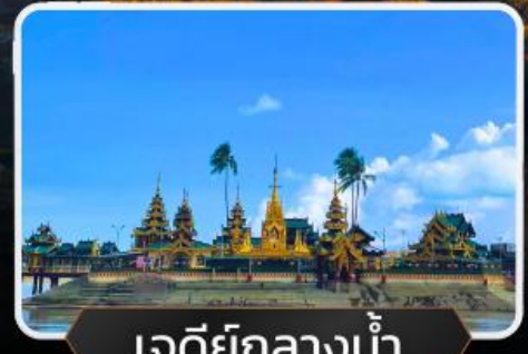
เจดีย์กลางน้ำ