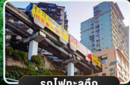
รถไฟฟ้าลูตึก

GT-TFUSL01 ฉงชิ่ง อุทยานหลุมฟ้า สะพานสวรรค์ 5วัน4คืน