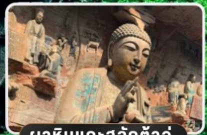
พาสืบแกะสลักต่างๆ