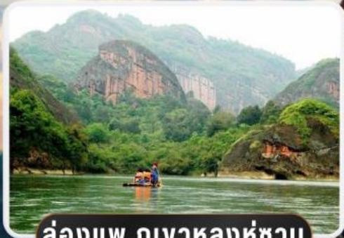
ล่องแพ กูเงาหลงหู่ซา