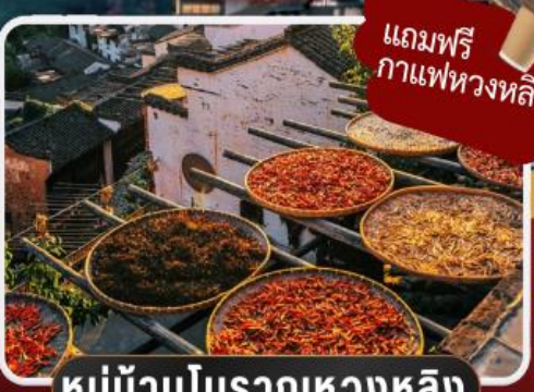
หมู่บ้านโบราณหวงหลิง