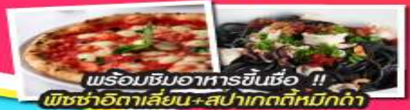
พร้อมชิมอาหารขึ้นชื่อ !! พิซซ่าอิตาลีแสน+สปาเก็ตตี้หมักดำ