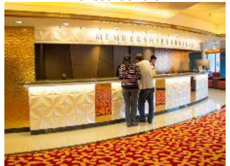
Membership Services Counter