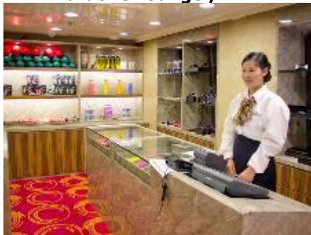
Port's O Call