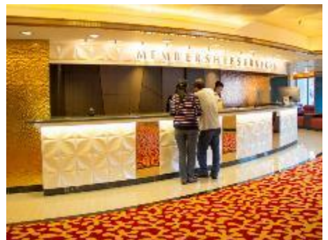
Membership Services Counter