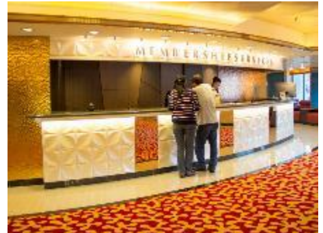
Membership Services Counter