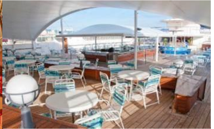
ห้อง Oceana Barbecue