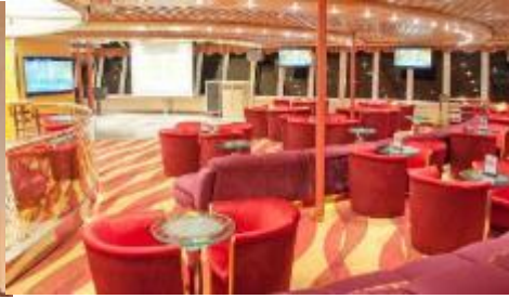
Karaoke Lounge / KTV