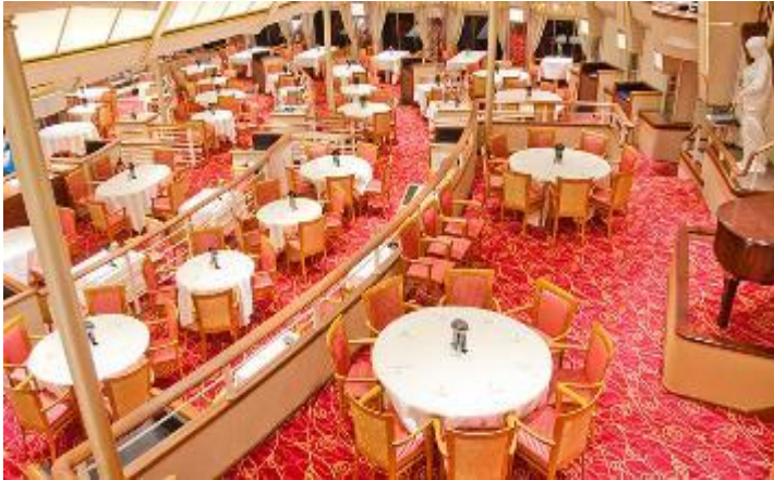
ห้อง Bella Vista

(กัสโต้ เวิลด์ ทัวร์ (สำนักงานใหญ่) 8/29 ถ.สุคนธ์สวัสดิ์ แขวงลาดพร้าว เขตลาดพร้าว กรุงเทพมหานคร 10230 โทร: 02 542 4040 แฟกซ์: 02 542 4292 Website: www.gustotour.com E.mail: gusto@gustotour.com ID LINE: @gustotour ใบอนุญาตเลขที่ 11/03295