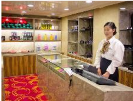
Port's O Call