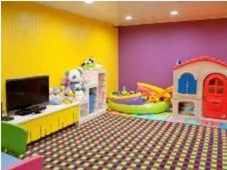
Child Care Centre