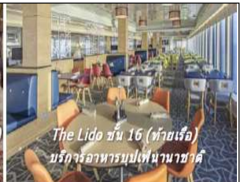
The Lido ชั้น 16 (ท้ายเรือ) บริการอาหารบุฟเฟ่ต์นานาชาติ

หมายเหตุ ทุกท่านสามารถเลือกซื้อแพคเกจเครื่องดื่มได้ ในระหว่างที่อยู่บนเรือ สำราญตลอดการเดินทาง เพียงใช้ CRUISE CARD ในการสั่งซื้อ รายละเอียดของแพ็คเกจสามารถขอได้จากเจ้าหน้าที่บนเรือสำราญ