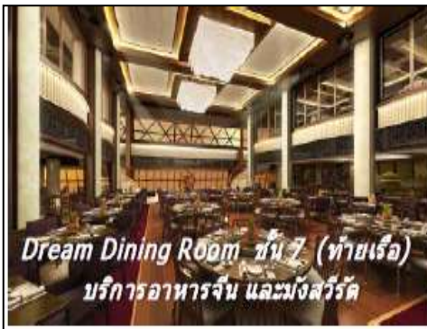
Dream Dining Room ชั้น 7 (ท้ายเรือ) บริการอาหารจีน และมังสวิรัต