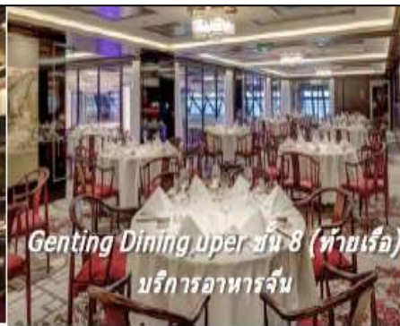
Genting Dining upper ชั้น 8 (ท้ายเรือ) บริการอาหารจีน